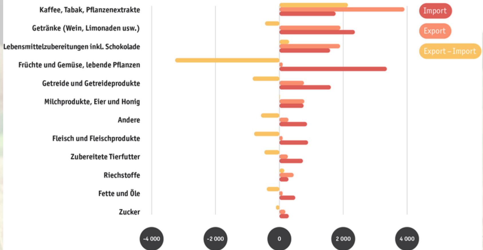
Agraraussenhandel 2022 nach Produkten, in absteigender Reihenfolge (in Mio. Fr.)